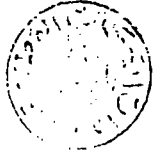
صورة عن أول ورقة من النسخة المعتمدة في التحقيق